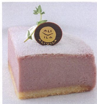
紅芋チーズケーキ Purple sweet potato cheese cake ¥800