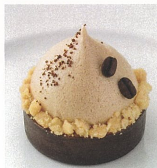
カフェモカ Cafe Mocha ¥900

※上記の金額には税金及びサービス料が含まれております。 A Service charge and government tax are included.