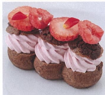
フランボワーズ シュー・ア・ラ・クレーム Framboise cream puff ¥800