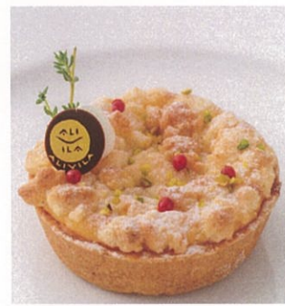
タルト ポンムフロマージュ Tart pomme fromage ¥800