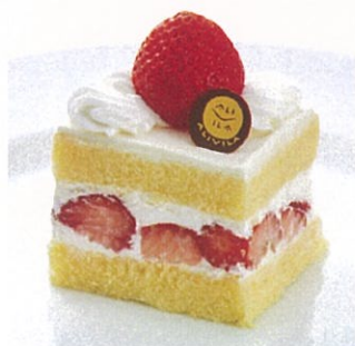
イチゴショートケーキ Strawberry Short Cake ¥900