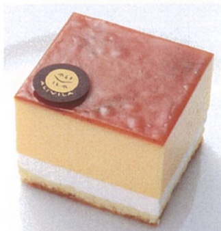
アリビラプリン Alivila Pudding ¥800