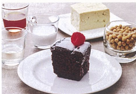
ヴィーガンスイーツ 島豆腐ガトーショコラ Vegan Tohu Chocolate cake ¥800